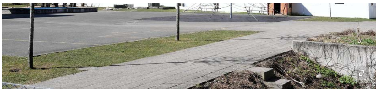
Mitte März sind die ersten Mieterinnen und Mieter ins Haus Süd an der Reutlingerstrasse eingezogen. Es ist das erste Haus der dreiteiligen Altersüberbauung Schneckenwiese im Zentrum von Seuzach, das fertig ist.